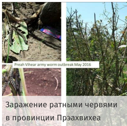
Заражение ратными червями в провинции Прэахвихеа